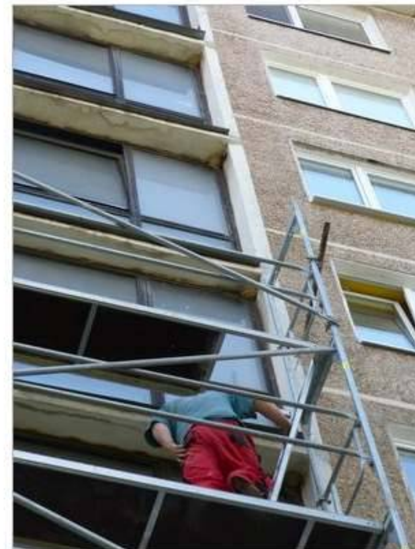
Belorítky domové si budujú hniezda nad oknami. Kvôli opravám bytoviek a zatepľovaniu často hynú.