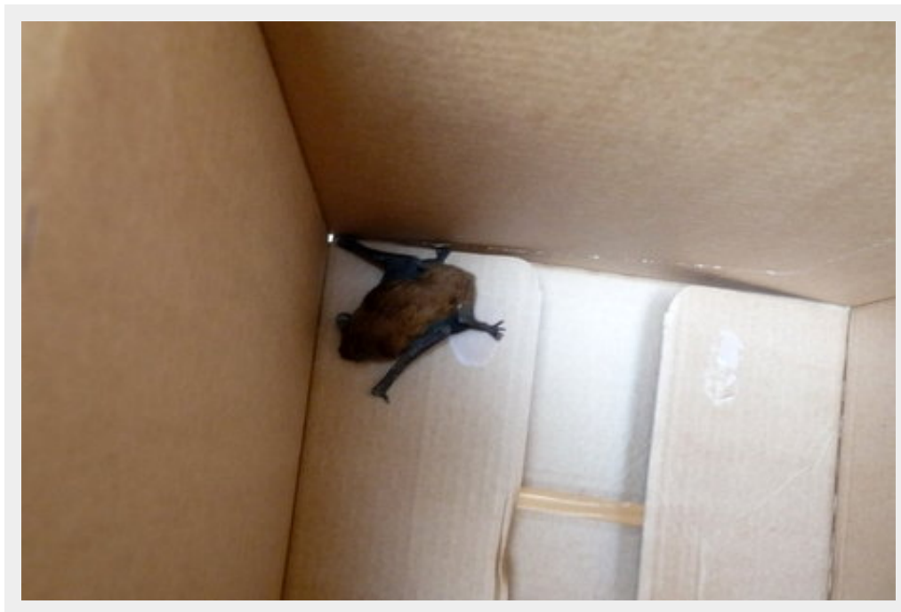
V Šamoríne odchytený raniak hrdzavý.

V posledných rokoch sa vďaka štátnym dotáciám vo veľkom rozbehli zateplovacie práce na slovenských sídliskách, vďaka ktorým dostávajú naše paneláky estetickejší vzhľad a podstatne lepšie izolačné vlastnosti.